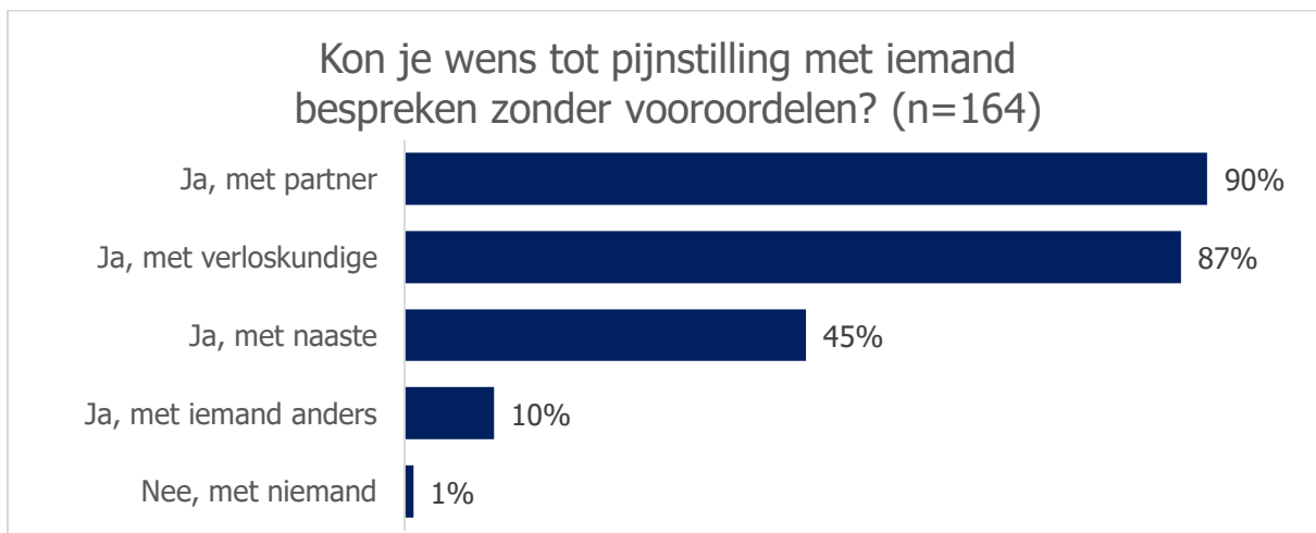
Figuur 3. Meerdere antwoorden mogelijk.

Bijna alle deelnemers met een pijnstillingwens bij de bevalling geven aan dat ze dit zonder vooroordelen konden bespreken, met name met de partner (90%) of verloskundige (87%), maar ook met een naaste (45%) of nog iemand anders (10%). Hier wordt o.a. gynaecoloog, verpleegkundige of vriendin genoemd. Zowel zorgverleners als omgeving reageerden bijna uitsluitend positief op deze wens.